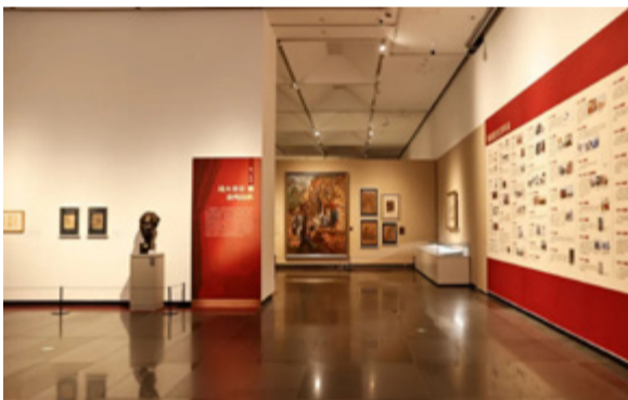
“艺术与时代的交响——冯法祀先生艺术研究展”展览现场

展览时间：2024年11月12日—2025年2月12日 展览地点：安徽省美术馆4号展厅