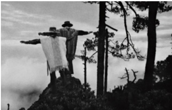
“巴西，重返大地——塞巴斯提奥·萨尔加多”展览海报

展览时间：2024年11月12日—12月1日 展览地点：中央美术学院美术馆四层展厅