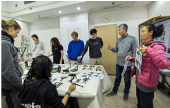
《艺术汉语》课堂现场

2024年10月，CCTV4《中国缘》10月13日的节目《我的根在中国》介绍了中央美术学院留学生汉语课堂。