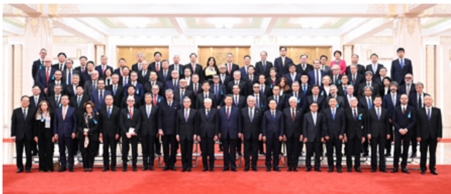
中意元首同双方代表合影留念

11月8日晚,国家主席习近平在北京同意大利总统马塔雷拉共同会见出席中意文化合作机制大会和中意大学校长对话会的双方代表。两国元首听取双方代表关于中意文化和大学合作有关情况的汇报。