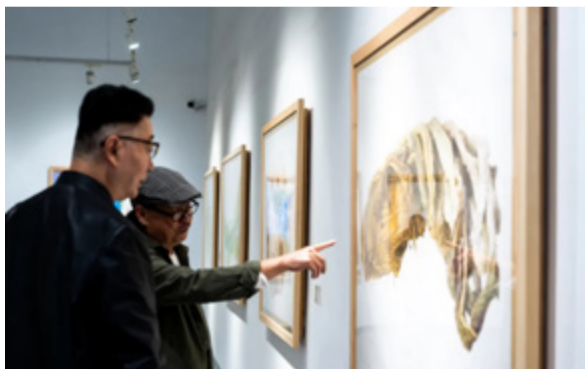
“中央美术学院精微素描巡展”开幕现场

展览时间：2024年9月28日—12月28日 展览地点：中央美术学院陶溪川美术馆（景德镇）