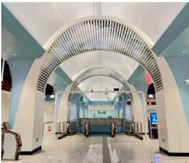
北太平庄站《梦想·飞翔》